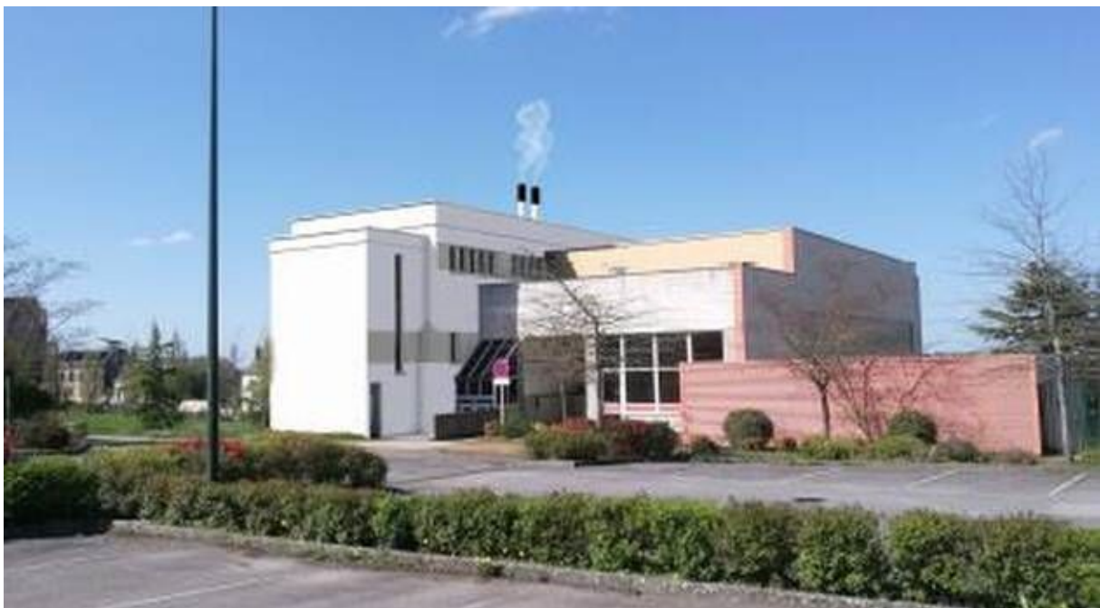
Le réseau de chaleur de Martigné-Ferchaud.

Ce sont trois chaufferies bois, donc trois réseaux de chaleur qui fourniront un mix à 90 % d'énergie renouvelable garanti en ressources locales bocagères. « Les agriculteurs fourniront 50 % de bois bocager localement », ajoute Sébastien Benoist.