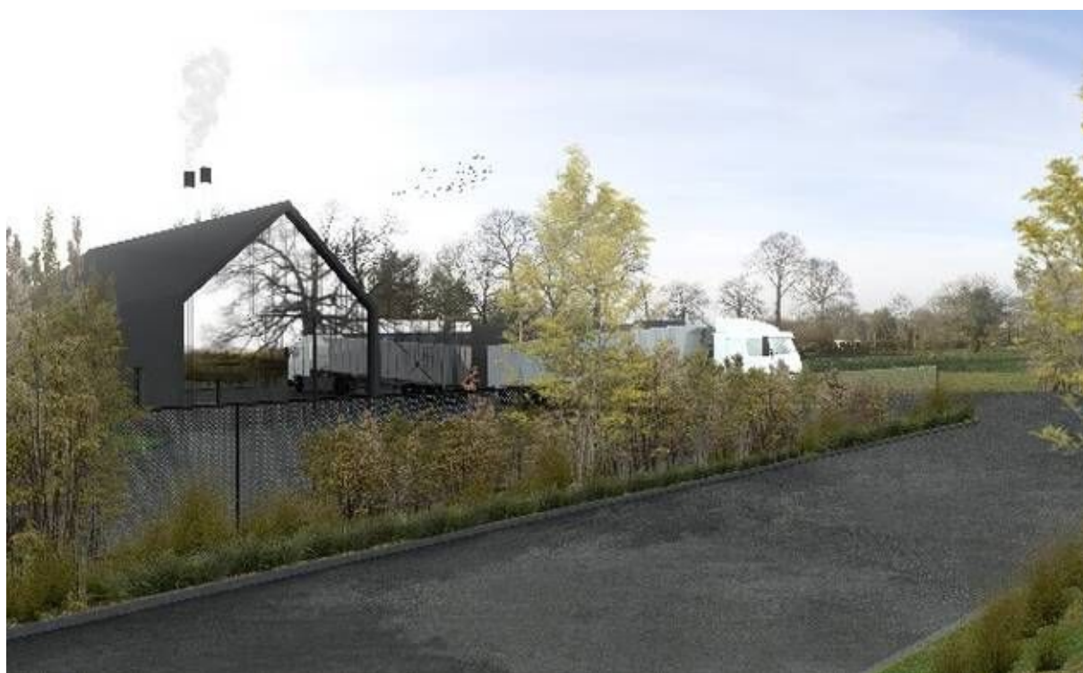
Le réseau de chaleur de Retiers.

La construction de ces trois projets nécessite un investissement total de 3 444 000 € et bénéficiera de 1 654 000 € de subventions.