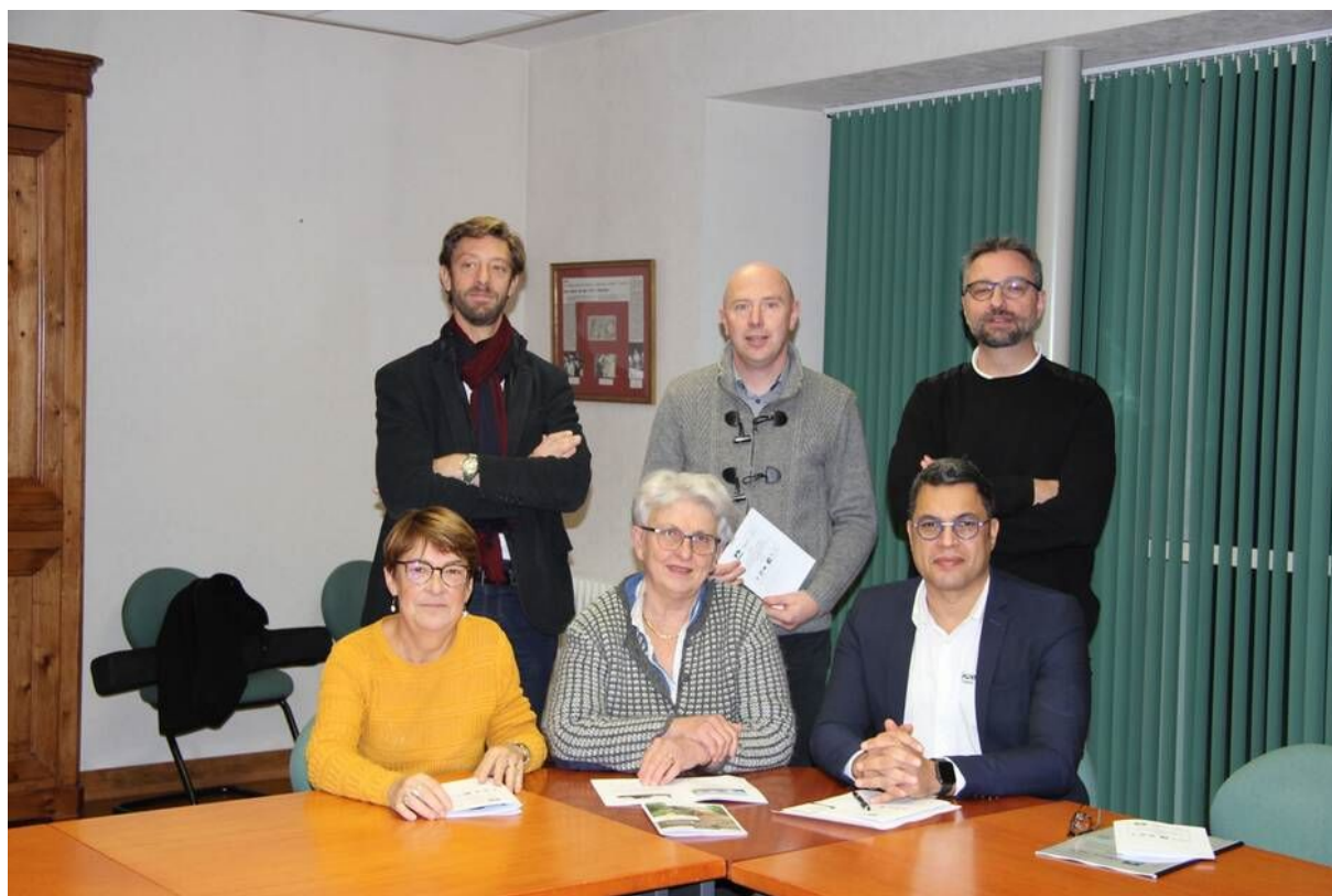
Les acteurs du projet de chaufferie.

Trois réseaux de chaleur bois vont être construits dans les communes de Retiers, Martigné-Ferchaud et Coësmes, pour chauffer les trois communes ainsi que Le Theil-de-Bretagne. Une campagne de financement participatif est lancée, une première dans l'Ouest pour ce type de projet.